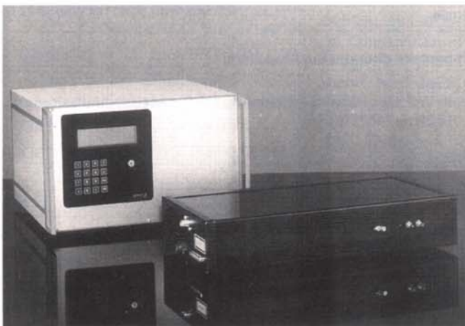
Bild 2. Alternativ zu Unterwasser- oder Helium-Prüfungen kommen immer häufiger laseroptische Lecktestsysteme in der Dichtheitsprüfung zum Einsatz